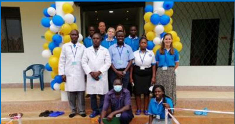
Feierliche Eröffnung 6. November 2021